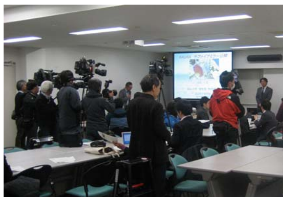
鏡移送を前にプレス発表