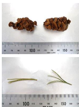
図 1. ハイマツ試料の写真 球果（上）、葉（下） 球果は中の種子を使用した

少傾向を示した。蔵王で採取した球果中の ^{14}\text{C} 濃度は 2018 年から 2022 年にかけて減少し、葉中の ^{14}\text{C} 濃度は 2019 年から 2020 年にかけて若干増加していたが、全体的には減少傾向を示した。一方、天童および東京で採取したマツ試料の ^{14}\text{C} 濃度は、球果、葉ともに値にばらつきがあったが、乗鞍および蔵王で採取したハイマツ中の ^{14}\text{C} 濃度と比較してどの年も低い値を示した。今後も継続して測定を行い、データを蓄積していきたいと考えている。