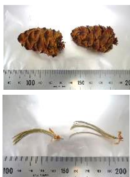
図 1. ハイマツ試料の写真 球果（上）、葉（下） 球果は中の種子を使用した

乗鞍で捕集された大気浮遊塵試料中の ^7\text{Be} 濃度測定データは、2019 年まで蓄積されているが、2020 年から 2023 年は covid-19 の影響により乗鞍では試料の捕集ができなかった。しかし、山形では 2023 年も ^7\text{Be} 濃度日変動データが得られている（詳細は、研究課題「Be-7 などによる宇宙線強度時間変化の検出」の報告書に示した）。今後も自由対流圏の ^7\text{Be} 濃度データの蓄積を継続し、地表データと比較する。