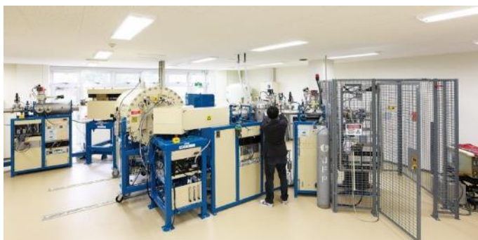
図 2. 山形大学高感度加速器質量分析装置