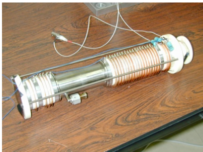
図1 高速イメージ遅延撮像管本体

高速イメージ遅延撮像管本体は、光電陰極と出力側の蛍光体付き基板、光電子の移動を制御するグリッド電極、電極支持部、セラミック絶縁体、ドリフト部などの各部を製作し、管内に電界を形成するための各種抵抗などを外部に取付け組み上げた。さらに、管内の移動電子の発散抑制に必要なソレノイド電磁石、高電圧を印可する電源、真空排气系を揃え検出器システムとしての構築を行った。撮像管の真空度を改善しながら高電圧の印可を行っている。宇宙線観測に適した電場・磁場遮蔽を兼ねたハウジングの設計・試作や、実験への適用を目指した性能試験を今後も継続して実施する。