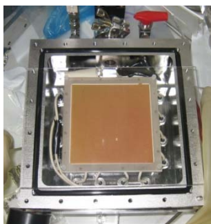
試作したCsIを蒸着したGEM

本年度は主に、ガス増幅型光検出器の開発を行った。まず、 中心要素である \mu PICとGEMを組み合わせ、長期安定に 10^5 以上ガス増幅する 10\text{cm}\times 10\text{cm} サイズの電子増幅部分を製作し、一電子を検出できる増幅器を確立 した。具体的には、高増幅率を持ったGEMとして、絶縁部にそれまでのポリイミドに代わりLiquid Crystal Polymer 100\ \mu\text{m} を採用したものを導入、イオンフィードバックを抑制し、ガスとしてはこれまで実績のあるAr+エタン(90:10)の混合ガスを用い実現した。次に、真空紫外光を通す \text{MgF}_2 で出来た入射窓に 30\text{nm} 程度の厚さのCsIを蒸着した直径 3\text{cm} の透過型光電面を製作し、電子増幅部と組み合わせ、光検出器としての原理検証を行い、 一光電子を検出することに成功 した。光源としては、東北大学多元物質研究所吉川グループ、(株)トクヤマと開発しているフッ化物真空紫外発光シンチレーターを使用した。この検出器の量子効率 \text{QE} は透過型CsI光電面として予想される 1\% @ 175\text{nm} 程度であり、基本的に設計どおりであったが、実用化するには量子効率を上昇させなければならない。そこで、 光子との反応確率を上げるため、GEMの側にCsIを厚く( 300\text{nm} 程度)蒸着した反射型光電面の開発を開始した 。これまでに、CsIを金メッキしたGEMに蒸着した光電面を試作し、 5\% 程度の量子効率を確認した。