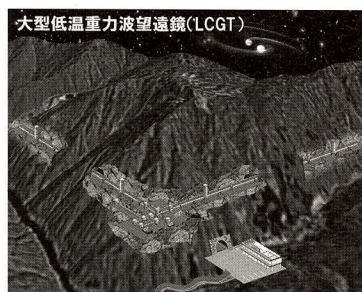
建設が始まる大型低温重力波望遠鏡の想像図。総延長6kmの地下トンネル内に設置される