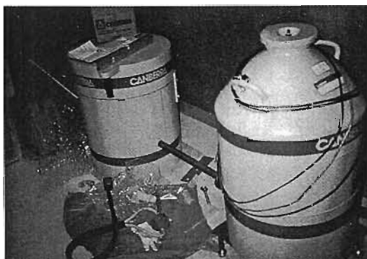
検出器デューワー及びシールド