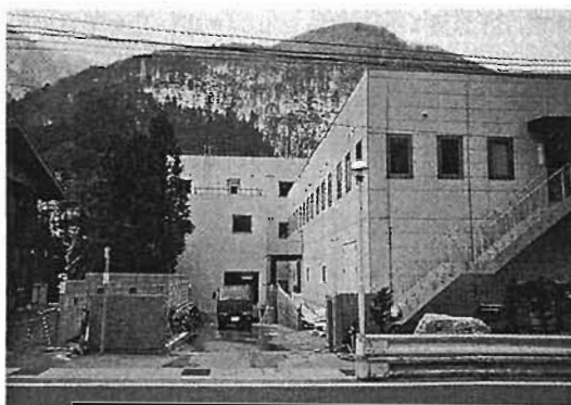
研究棟（奥の3階建ての建物）と計算機棟（手前）