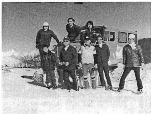
交替者を迎えに行き大雪渓付近にて記念写真を撮る。 昭和57年3月

来光を迎えたこと、昭和59年8月の観測所勤務中に毎朝午前6時に起床して山頂への21回連続登頂をして乗鞍神社の神主に記念品を頂いたことなど、多くの思い出が浮かんできます。