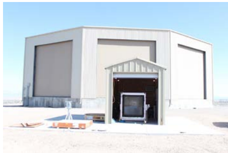
図 2: ユタ州 TA サイトの TA-EUSO 望遠鏡。後ろに TA の Black Rock Mesa FD ステーションが見える。